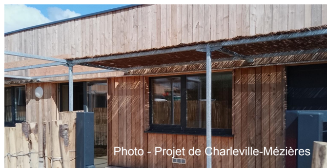
Photo - Projet de Charleville-Mézières

BET fluide/thermique : BET Climat Ingénierie