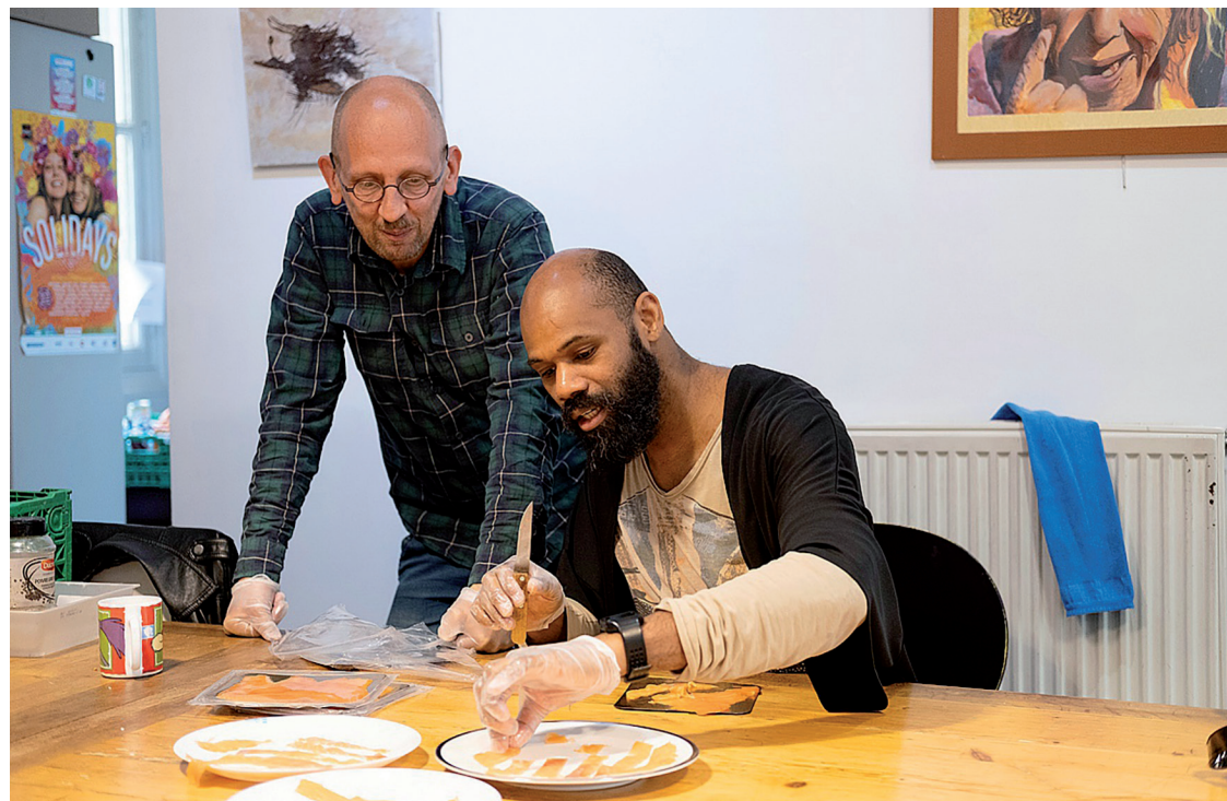
Deux familiers de Basiliade préparent le repas à partir de dons de nourriture.

Depuis 2005, le ministère de la santé n'alloue plus de fonds pour