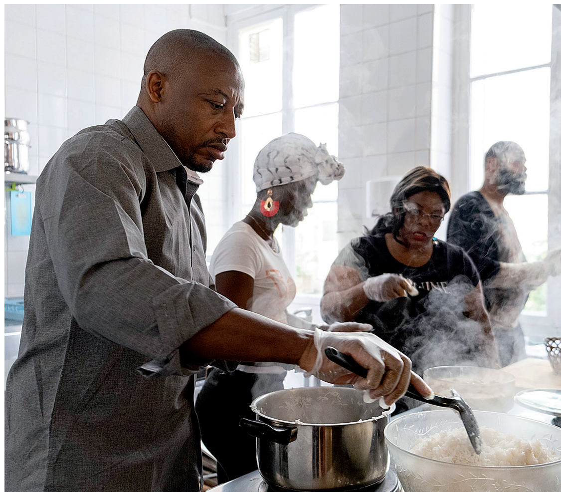
L'association Basiliade propose à des personnes atteintes du sida de partager un repas préparé ensemble par les bénéficiaires eux-mêmes.

L'encours total d'épargne solidaire approche les 13 milliards d'euros. Le secteur de la santé, notamment, en bénéficie.