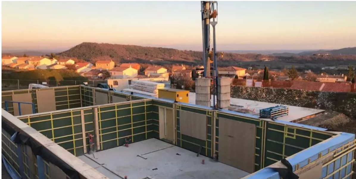
Photo des travaux réalisés