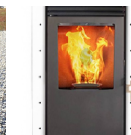
Poêle à granulés