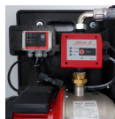
La récupération d'eau de pluie