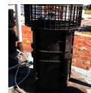
La ventilation simple flux ou double flux