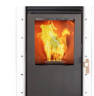
Poêle à granulés