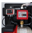
La récupération d'eau de pluie