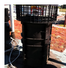
La ventilation simple flux ou double flux